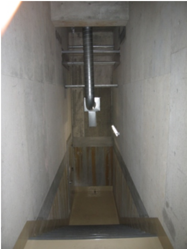
今回テスト中階段室（実際は少し暗い）